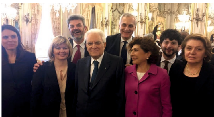
22 marzo 2017, a Roma col Presidente Mattarella in occasione dei 60 anni dei trattati