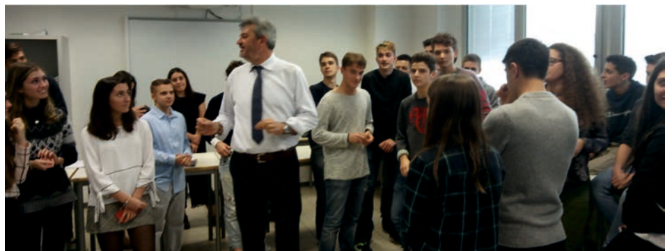
Parma, Liceo scientifico "Attilio Bertolucci"