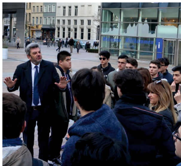
Incontri e visite guidate al Parlamento Europeo con gruppi di studenti e insegnanti e gruppi di amministratori locali e rappresentanti dell'associazionismo