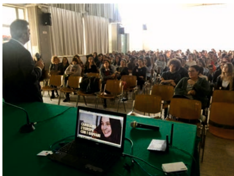
Cesena, Liceo linguistico "Ilaria Alpi"