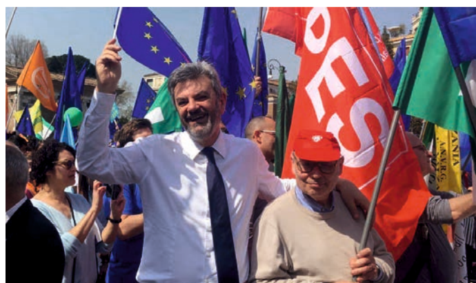
A Roma alla festa dei 60 anni dei trattati che hanno istituito l'Unione Europea